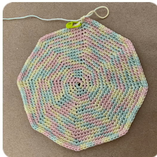
Začátek háčkované koruny: