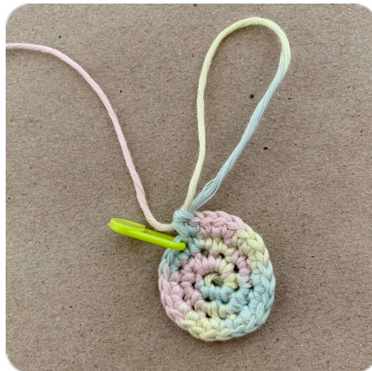
Začátek střechy po 3. řadě:

8. řada: Do prvních pěti ok udělejte krátký sloupek. Do šestého oka udělejte 2 krátké sloupky. Opakujte dokud nedokončíte řadu.