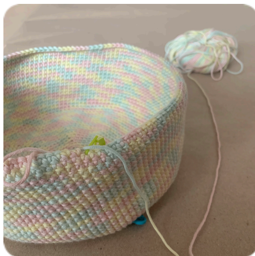
Bucket hat se zaobleným přechodem mezi střechou a korunou: